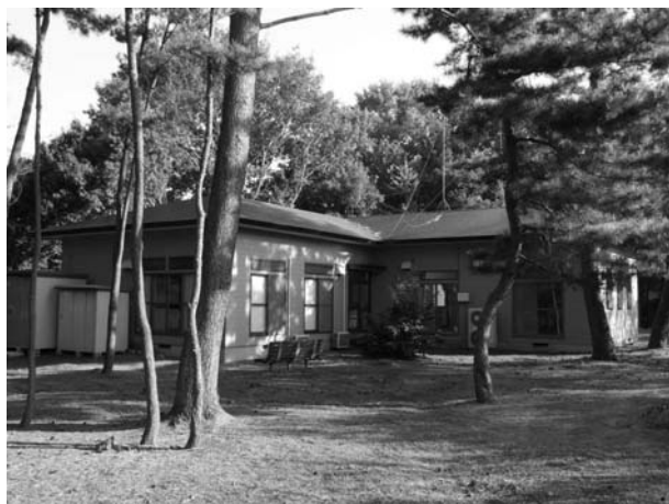
公園の木々に囲まれた梅園集会所（現在）

にも使われています。小学生対象の4つの子供会、「たんぼぼ」や「うみだ」といった未就園児・乳幼児とその親達の参加するサークルが活動しています。また、和室ではみどり会の俳句会（今は会員の自宅に移りました）、囲碁会、パッチワークなどのサークルが活動しています。図書室（5m 2 ）は「梅園文庫」によって運営され毎週水曜日（10：00～11：30）に本を借りることが出来ます。