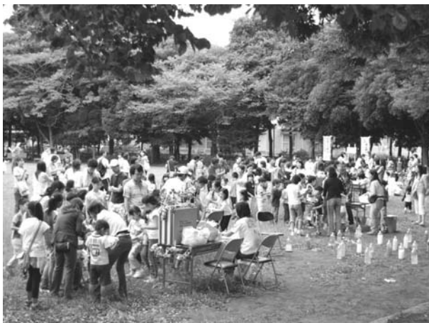
夏まつりの様子 - 沢山の方々が参加されました

当日は17時過ぎから親子の参加予約券受付を開始し、4つの縁日コーナーを設け、パトロール開始まで親子で楽しんでもらう、お祭りとなりました。