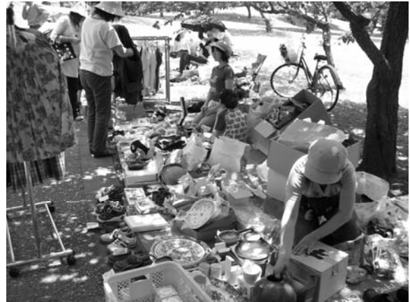
楽々市フリーマーケットの様子