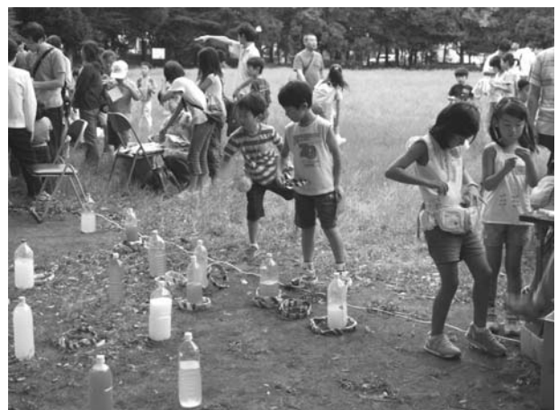
縁日 - わなげ