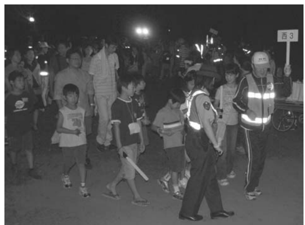
さあ、パトロールに出発です