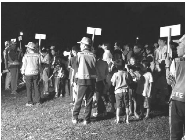
9班に分かれて集合です

18時30分頃からパトロールの準備に入り、来賓の警察、市の方々、東小学校長のご来場をいただいたなかで、いよいよパトロールに出発しました。パトロールは9コースに分かれ、それぞれ自警団、警察の付き添いで約30分の町内パトロールをしました。いつもの静かな町内も、この日ばかりは元気な子供たちの防犯を呼びかける声で賑わっていました。19時30分、全員無事に公園に戻り、報道関係の撮影やインタビューなどがあって、盛況のうち散会となりました。