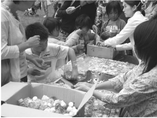
縁日 - くじ