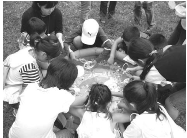
縁日 - スーパーボールすくい

地域ではこのような、一緒になって親子、お友達とのふれあう場が少ないため、子供たちの大喜びで夢中に遊ぶ笑顔にふれることが出来、大変うれしく思いました。