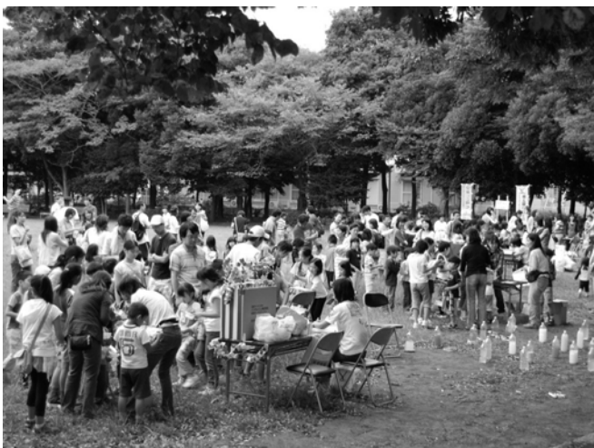
梅園公園での夏まつりの様子

今年はそれぞれの活動のほかに、自治会の夜間親子パトロールと共催で、初めて4つの子ども会合同の夏まつりも開催しました。小学生だけではなく赤ちゃんから大人まで、たくさんの方に参加していただき、とても楽しい時間を過ごすことができました。