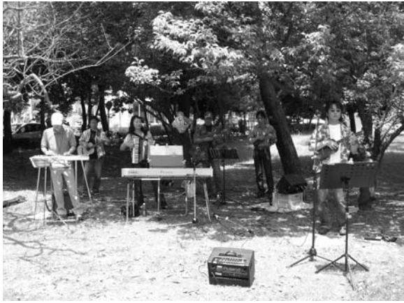
ウクレレキッドとその仲間マカマカの皆さんの演奏