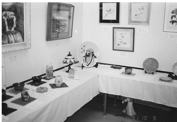
1991年11月9日に開催された作品展の様子

建設されてから当初10年位は、2年に1回、「みどり会」による作品展が催され、絵画や書、篆刻（てんこく）、陶芸品、編み物、パンフラー、手芸品など200点近くが展示され、見た人はそのレベルの高さにびっくりしていました。バザーもありました。ホール（73m 2 ）の床は運動しても大丈夫な構造に造られ、卓球台なども寄贈されました。現在みどり会の太極拳やファミリーサークルによるストレッチ、あるいはダンス