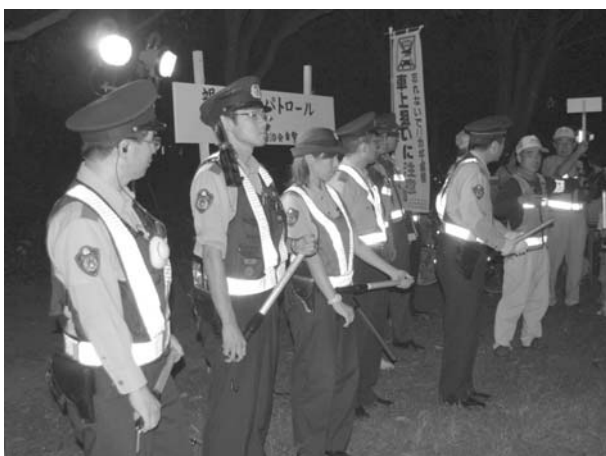
警察署の方々にもご協力頂きました