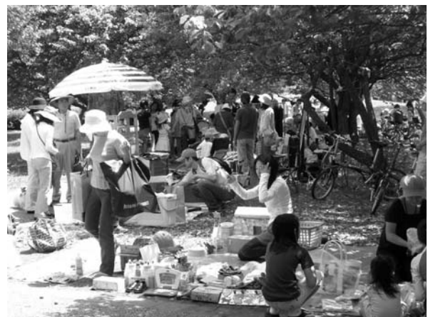
楽々市フリーマーケットの様子