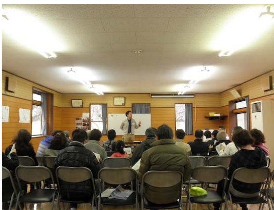
危機管理課屋代さんの講話