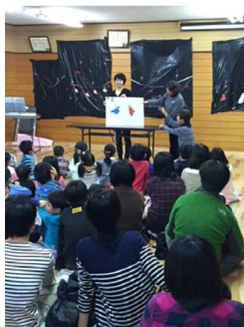
梅園文庫による大型絵本読み聞かせ