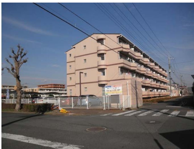
1月6日交通事故発生の現場

県内350件以上、被害総額10億円以上、つくば市内でも18件4333万円の被害があったと注意喚起があった（赤塚交番管内犯罪発生状況は最終ページ）。