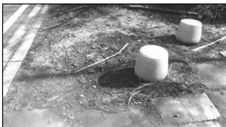
ひまわり公園北東出入口

北東角の公園出入口ですが、地表5cmの高さでは2013年3月に0.8と高い値でした。13年12月の測定で一旦下がったかに見えたのですが、14年3月の測定では0.65を示し、その後の測定では漸減して15年3月は0.45、15年中は0.35くらいでした。地上50cm高では0.2~0.3でしたが、今は0.2以下となっております。まだ少し高めですが除染するには側溝の撤去工事をしなければなりません。そこを通ったとしても長時間いる場所ではないので、このまま経過を観察したいと思います。