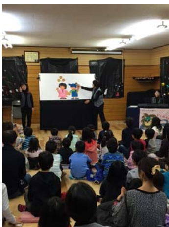
パネルシアターかくれんぼ

今年は、前日の準備と当日終了後の片付けに、梅園文庫メンバー以外の方々が、お子さんも連れて沢山参加して下さり、運営がスムーズにかつ楽しんでできました。ありがとうございます。