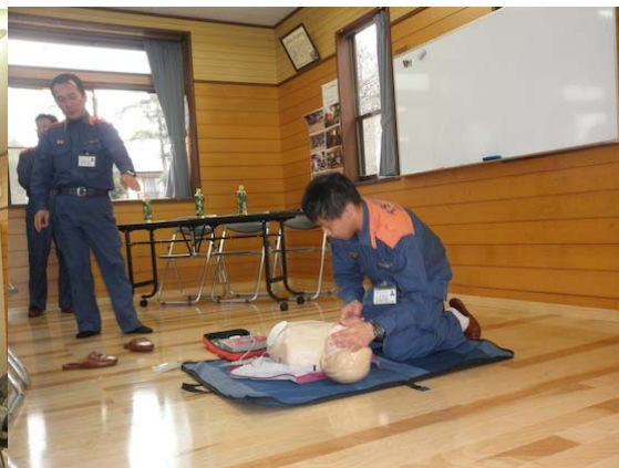
消防署並木分署の方の心肺蘇生とAED実施