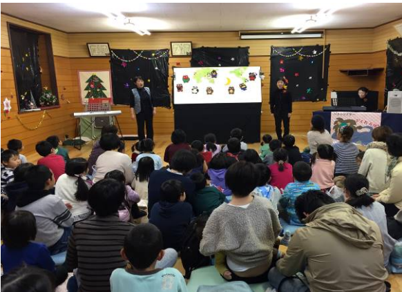
パネルシアターかくれんぼ

今年も、昨年に引き続き、前日の準備と当日終了後の片付けに、梅園文庫メンバー以外の方々も親子でお手伝いをしてくださいました。家庭の事情等で参加できるメンバーが少ない中、運営に当たって大きなお力添えをいただきました。本当にありがとうございます。