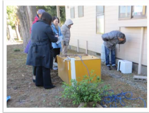
ポンプで井戸水を汲み上げているところ