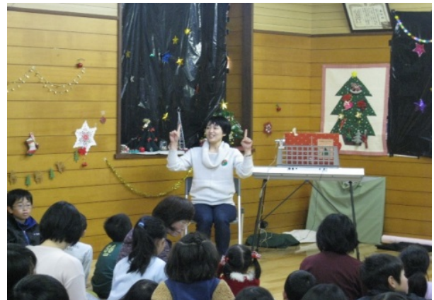
梅園文庫によるおはなし