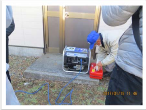
発電機を動かしているところ