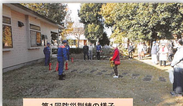
第1回防災訓練の様子 (写真②Ⓣ 2019年11月30日)