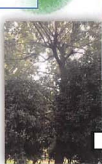
(写真) 梅園公園内 令和元年12月実施済み

地区内3箇所の山ゆり・ひまわり・梅園公園も、皆さまの憩いの場として、ますます愛されるよう年間を通じて整備を進めてまいりました。