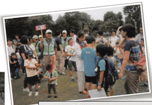
元気に集う子供たち—。さあ、防犯パトロールに出発です！