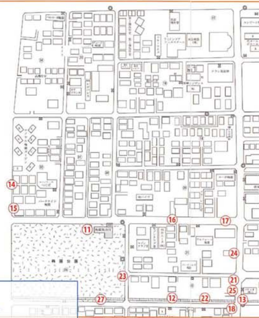
【西1・西2ブロック要望図】