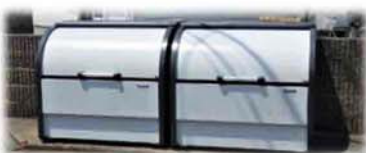
更新されたごみ 収集場(19-B)