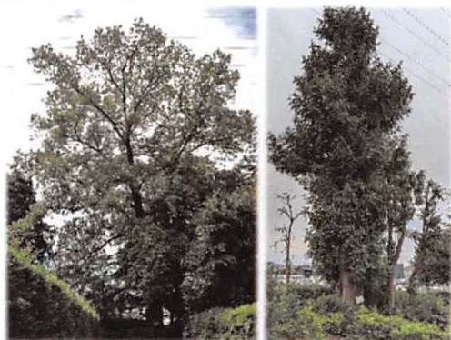
左：5年前の雄姿、右：今年の姿