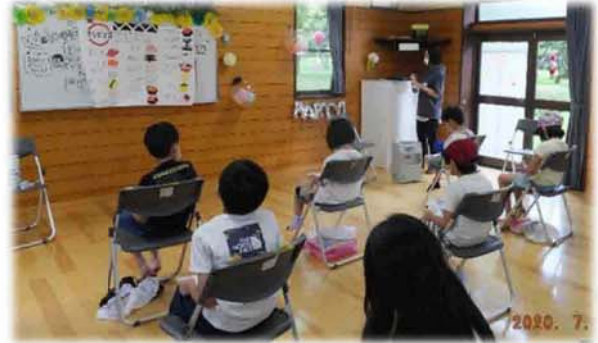
西子供会の活動の様子

残念ながら夏の一大イベントのラジオ体操は、不特定多数の参加を鑑みて中止と致しましたが、今後も参加者の安全を第一に感染状況を注視し、実施の際は感染対策を徹底したうえで、子供の憩いの場を提供できるよう取り組みたいと考えています。