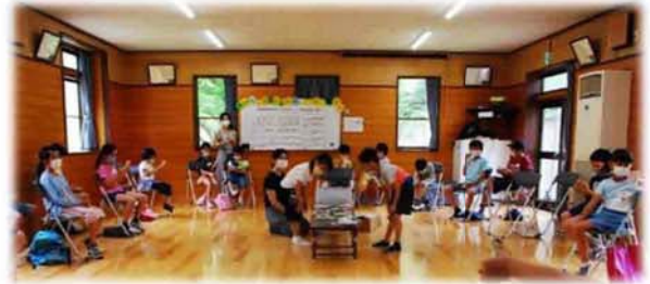
東子供会の活動の様子

そっとフォローする子など、子供たちの様々な姿が見られ、ビンゴゲーム等では異学年で楽しいひと時を過ごすことができました。