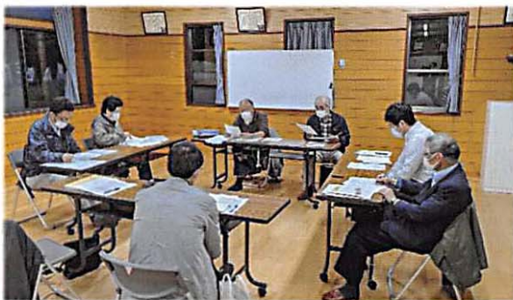
第2回幹事会の様子