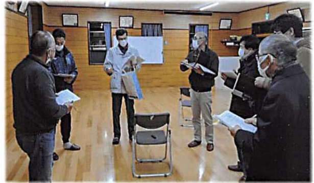
須田会長(左端)・幹事による第1回幹事会