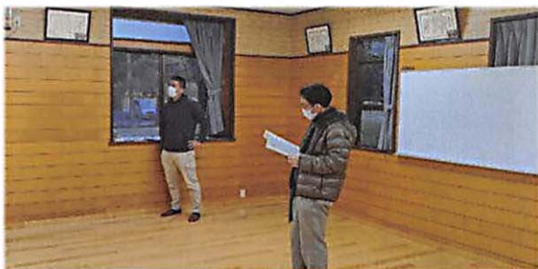
中島会長(左)による総会議事進行

新型コロナウイルス感染防止のため、前年度と本年度の幹事 16 名のみが参集し、立ったままという異例の総会となった。