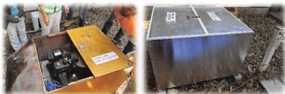
左：旧木製カバー 右：新アルミ合金製カバー