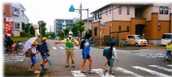
福田自警団長の立哨指導

上記防犯活動を行っていますが、現在新型コロナウイルス感染拡大防止のため、一部の活動を自粛しております。