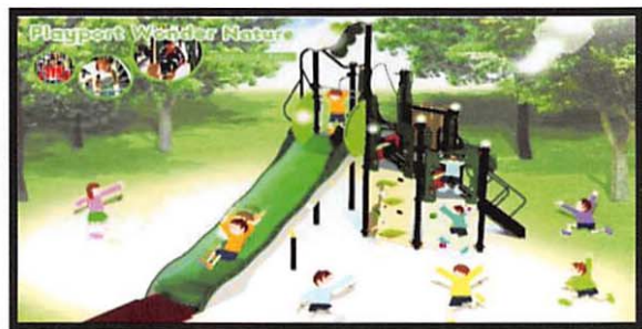
人気が高かったB案のデザイン図