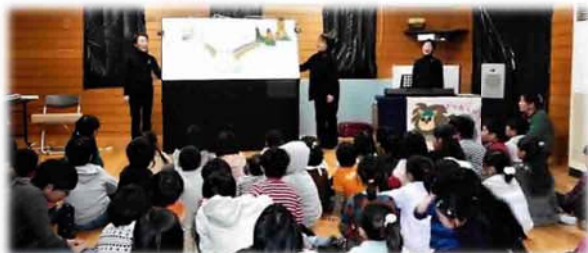
昨年のお楽しみ会「パネルシアター」の様子 集会所に100人！今では考えられない3密です！

マスク着用の上、無理のない範囲でご参加ください。参加費は100円です。昨年は、子供会の協力を得て、子供料理教室やお楽しみ会を開き、楽しいひとときを過ごしました。