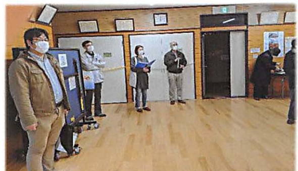
新旧幹事による総会風景

委任状の総数 362 枚 (東 1 : 72、東 2 : 83、西 1 : 81、西 2 : 70、南 : 56)、出席者 16 名 (東 1 : 5、東 2 : 3、西 1 : 3、西 2 : 2、南 : 3)、総数 378 名は会員数 516 の過半数であり、この総会は成立。