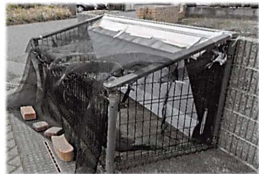
3月の大風でカバーの大半が失われたゴミ集積所 (すでに更新されたそうです)